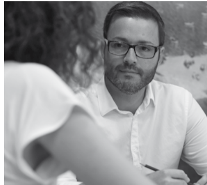
JOSÉ HILA Alcalde de Palma

Veo la Nit de l'Art con ganas de crecer y de conseguir aportarnos cosas interesantes...Palma es una ciudad llena de galerías, y esto indica que hay interés por el arte y por los artistas. Es muy importante que la cultura tenga una presencia destacada en Ciutat , porque nos ayuda a potenciarla a nivel turístico y también, porque nos ayuda en el reto de conseguir una sociedad más culta.